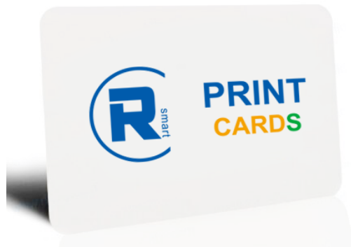
实物图 (Product Image)